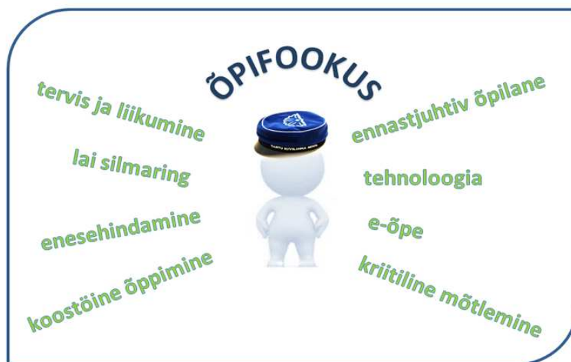
Joonis 2. Õpifookuse peamised märksõnad

Peamised märksõnad, millele õpiprotsessis Kivilinna koolis keskendutakse, on tervis ja liikumine, lai silmaring, enesehindamine, koostöine õppimine, ennastjuhtiv õpilane, tehnoloogia, e-õpe ja kriitiline mõtlemine (Joonis 2). Täpsemate tegevuste ja märksõnadena on õpifookus lahti kirjutatud Lisas 1.